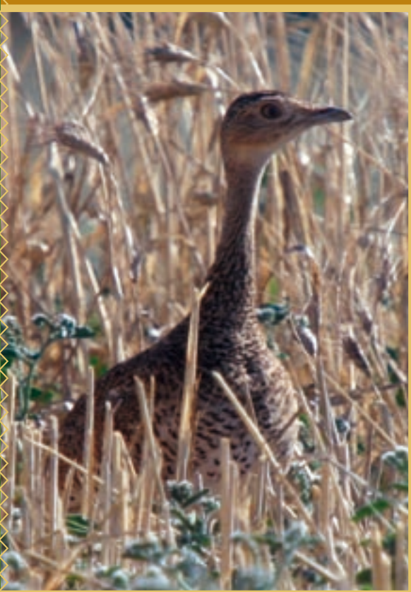
Femelle d'Outarde canepetière à peine visible dans les chaumes de céréales