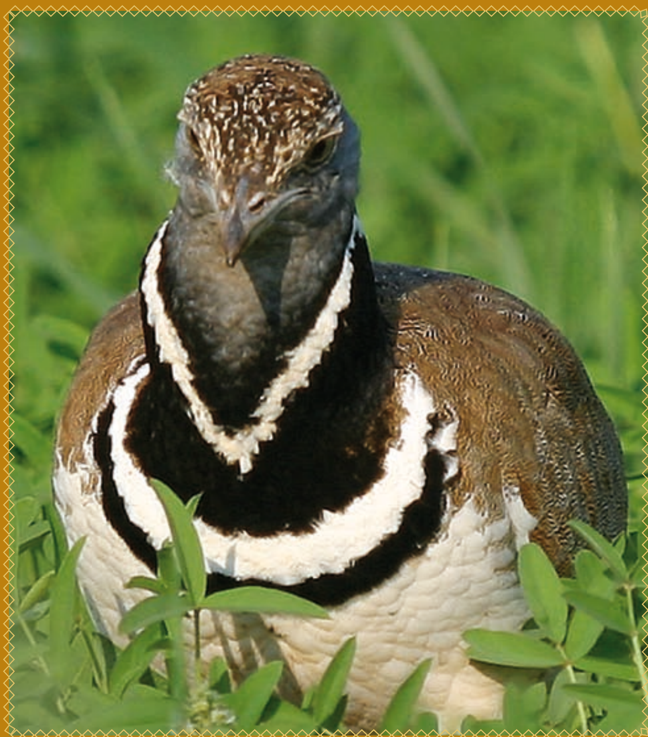
Mâle d'Outarde canepetière dans un sainfoin