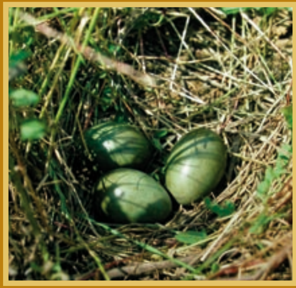
Ponte d'Outarde canepetière déposée à même le sol